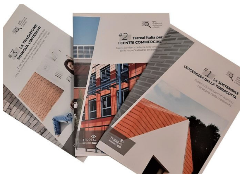
QAD_Quaderni d'Architettura e Design.

Redazione Il Commercio Edile 23 luglio 2019